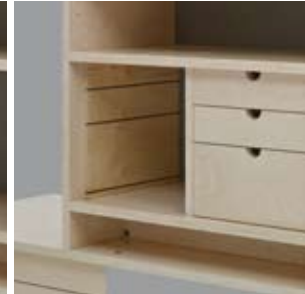
Seitenwand zum Einschieben für Schubladen oder Fächer