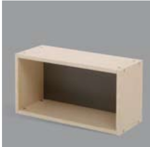
Stapelregal O HR/SR/H386B750T288/O

Die Elemente haben saubere Sichtrückwände, diese und die Schieber können auch (transparent) als Vitrine und verstellbaren Einlegetablarer versehen werden.