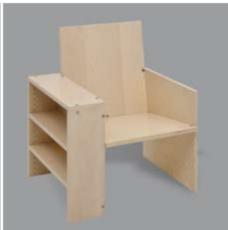
Lehnstuhl mit Regal links HR/LS/BA992/GARL