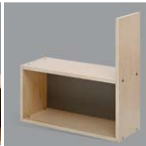
Stapelregal d HR/SR/H772B750T288/d