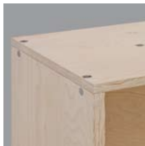
Detail mit Plattenquerschnitt folgt