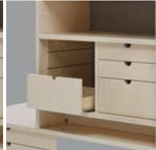
Schubladen 1/2H 1/4H