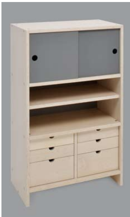
Sideboard CA HR/SB/BA750H1206T416/CA