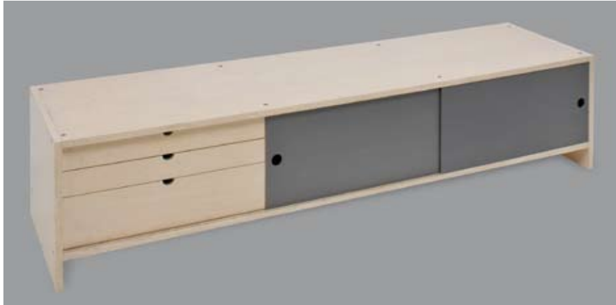
Sideboard AC HR/SB/B2204H480T576