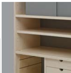
offenes Regal mit Einlegetablar