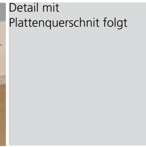
Detail mit Plattenquerschnitt folgt