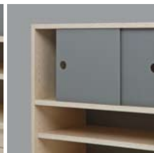
Schränkelement mit Schiebern