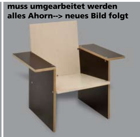
Lehnstuhl mit Armauflagen HR/LS/BA992/GAB