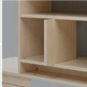
Zwischenwand zum Einschieben

Die Masse sind aus dem Bestellcode ablesbar: H Höhe (Plattenmass) HA Höhe (Aussenmass) B Breite (Plattenmass) BA Breite (Aussenmass) T Tiefe (Plattenmass)