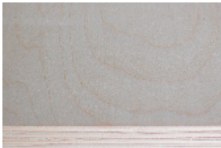
Sperrholz Ahorn roh Kern Weissstanne Schweizer Holz und Produktion FSC zertifiziert