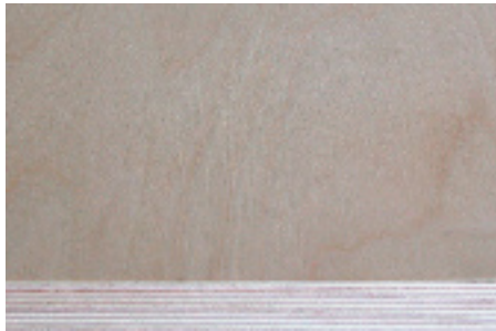
Birke Multiplex roh Qualität IQ Zertifikat: PEFC / BVQi