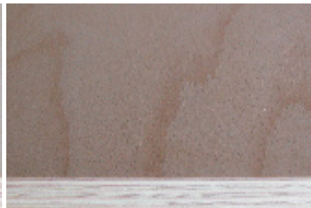
Sperrholz Buche roh Kern Weissstanne Schweizer Holz und Produktion FSC zertifiziert