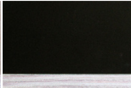
Birke Multiplex bakelisiert Qualität IQ Zertifikat: PEFC / BVQi