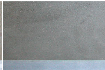
MDF Holzfaserplatte Dicke 25mm nicht für alle Konstruktionen geeignet verschiedene Farben