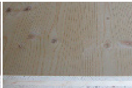
Dreischichtplatte Fichte Dicke 25mm nicht für alle Konstruktionen geeignet