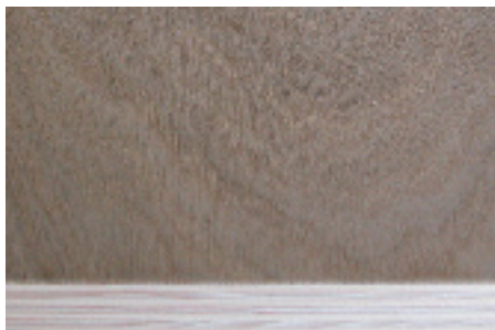
Sperrholz Eiche roh Kern Weissstanne Schweizer Holz und Produktion FSC zertifiziert