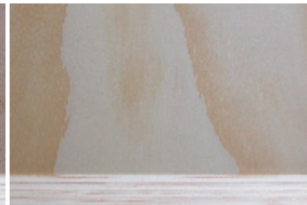
Sperrholz Tanne geschält roh Kern Weissstanne Schweizer Holz und Produktion FSC zertifiziert