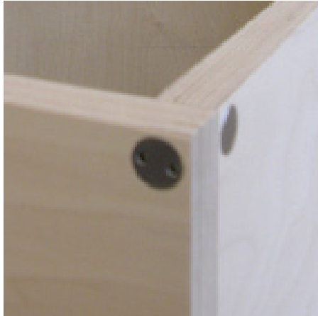
Verbindung von zwei stehenden Platten