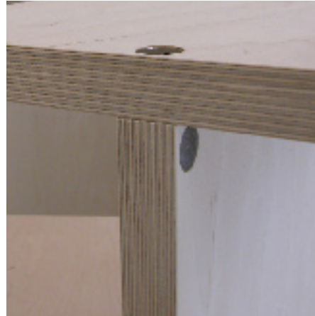
T-förmige Verbindung einer liegenden, durchgehenden Platte mit einer stehenden Platte