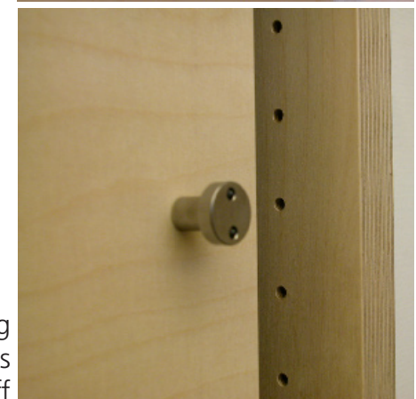
Beschlag als Türgriff