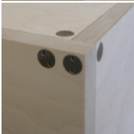
Verbindung von zwei stehenden Platten und einer liegenden Platte