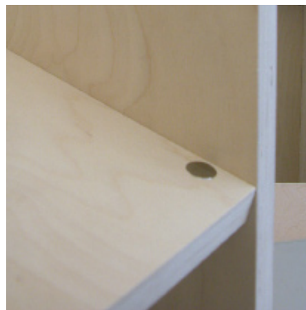
diagonal eingesetzte, liegende, oder stehende Platte