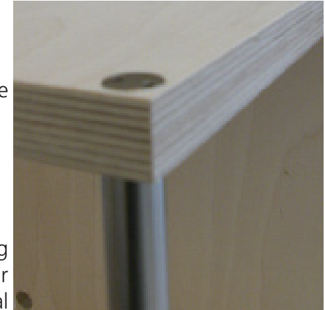
Verbindung mit Rohr vertikal