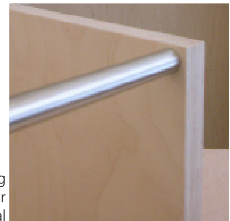
Verbindung mit Rohr horizontal