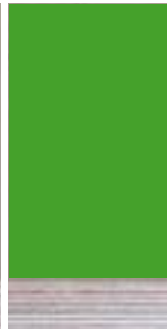
domibond Kern Fichte beidseitig Kustharz- belegt*