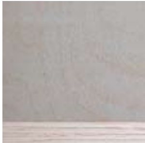
domibond- Platte 23 und 19mm Kern Fichte Deckfurnier Ahorn

Neben domi- Möbeln aus domibond- Platten bieten unsere Servicepartner individuell gestaltete und dominorm01 Cargomöbel gefertigt aus handelsüblichen Platten* an.