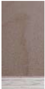
domibond Kern Fichte Deckfurnier Buche*