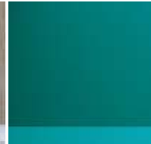
Als Sonderanfertigung sind praktisch alle Mate- rialien inkl. leichte Sand- wichplatten (mir Rahmen) oder allseitig mit Kunstharz belegte Versionen möglich.