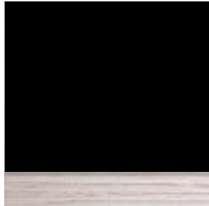
domibond- Platte 23 und 19mm Kern Fichte Deckfurnier Ahorn für Tischflächen einseitig belegt mit Linoleum schifergrau