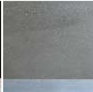
MDF Holzfaserplatte* 19 mm 25 mm nicht für alle Konstruktionsformen geeignet

Farben: natur braun schifergrau moosgrün