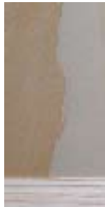
domibond Kern Fichte Deckfurnier Tanne*